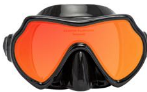
Seadive EagleEye RayBlocker HD