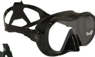
<- Apeks VX1