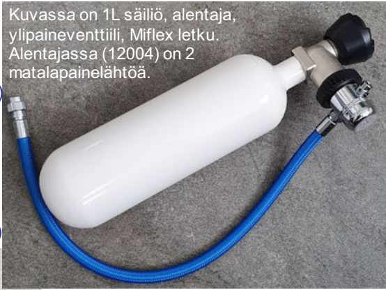
Kuvassa on 1L säiliö, alentaja, ylipaineventtiili, Miflex letku. Alentajassa (12004) on 2 matalapaineilähtöä.