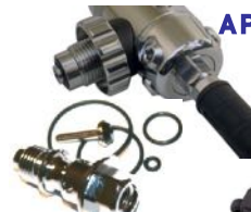
AP0274 5. MP lähtö DST:n perään. Setissä myös uu det tiivistet ja popetti