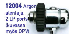
12004 Argon alentaja, 2 LP ports (kuvassa myös OPV)