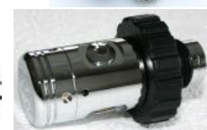
HL406 Highland, 2 LP ports, 1 HP port