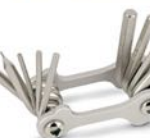
AI0683 Kuusioavaimia (sopii Apeksiin) ja ruuvareita