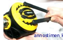
138. Säädettyvä annostimen kannen avain

REGUSETIT VOIDAAN RAKENTAA ERI KOMPONENTEISTA AINA TARPEEN MUKAAN.