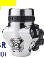
Apeks FSR (XTX200)