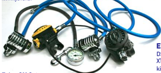
Esim. DS4 Set ->

DS4 alentaja, XTX50 & XTX40 annostimet, Miflex 150cm & 62cm letkut, kiinnityshaka, vara-annostimen kaularipustus, SPG52 painemittari, 80cm HP letku, kiinnityshaka.