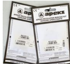
AP0241 & AP0219 Apeks huoltokitit

TL117. Silikoniin lähty annostimen kannen (tai hillopurkin) avaamiseen