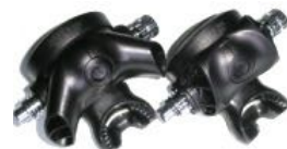
XTX annostimiin on saatavana vaihtoviikset. Annostimen voi asentaa myös "vasen käitsekseksi"