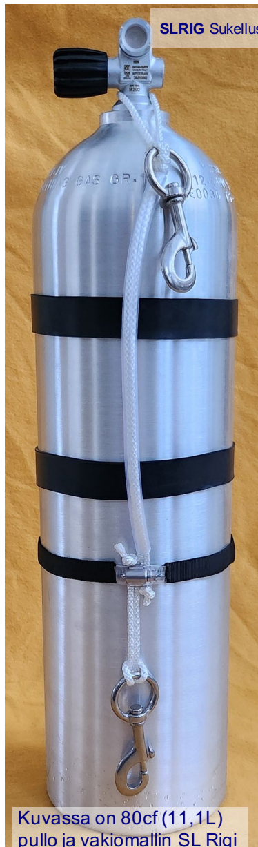
SLRIG SukellusLuola -Rigging Kit

Rigin narun ja kahvan pituutta voi säätää kun mitään ei ole liimattu tai ommeltu. Tai ylempään hakasen voi jättää pois jos pullon yläpää ripustetaan sidemount -tyyliin bungeelenkillä.