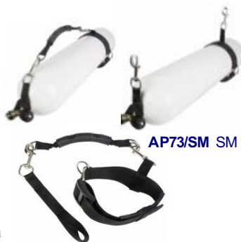
AP73/SM SM rigi

Kumirenksu stageen vetorensulla. L Ø175-203mm pullolle (esim. 80cf), S Ø101-140mm pullolle (esim. 40cf ja teräs 7L). Renksun leveys n. 25mm.