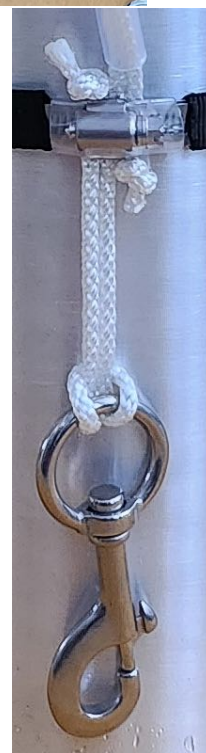
Hakasten asennus naruuin